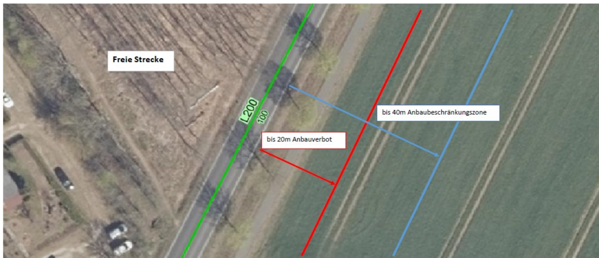
Freie Strecke – Visualisierung der Anbauverbots- und Anbaubeschränkungszone